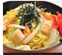
オホーツク北見塩やきそば