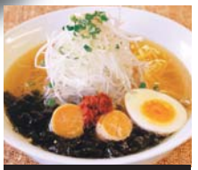
オホーツク干貝塩ラーメン