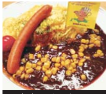
富良野オムカレー