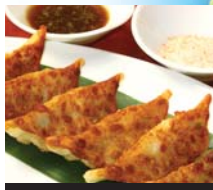
羽幌えびタコ焼き餃子