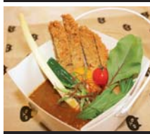
南富良野エゾカツカレー