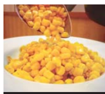
十勝芽室コーン炒飯