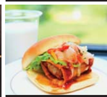
別海ジャンボホタテバーガー